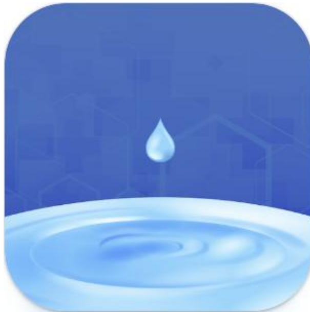
Afbeelding: Cohera Cardiac Coherence

Open de App Store (iPhone) of Play Store (Android), zoek op "Cohera Cardiac Coherence", download en open.